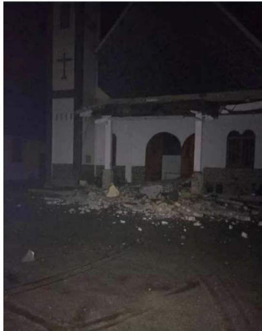
Dokumentasi : Kerusakan Rumah Ibadah di Tarutung