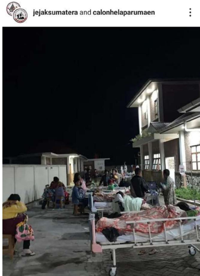
Dokumentasi : Keadaan Luar RSUD Tarutung