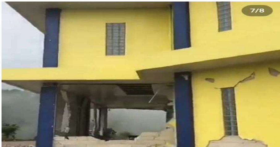
Dokumentasi : Kondisi Gedung Museum dan Arsip HKBP