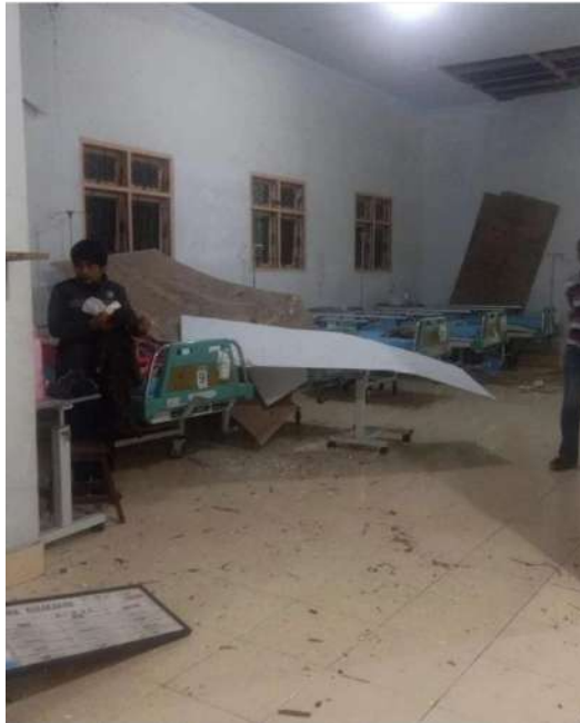
Dokumentasi : Kerusakan di RSUD Tarutung