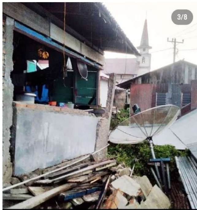
Dokumentasi : Kondisi Rumah warga Tarutung