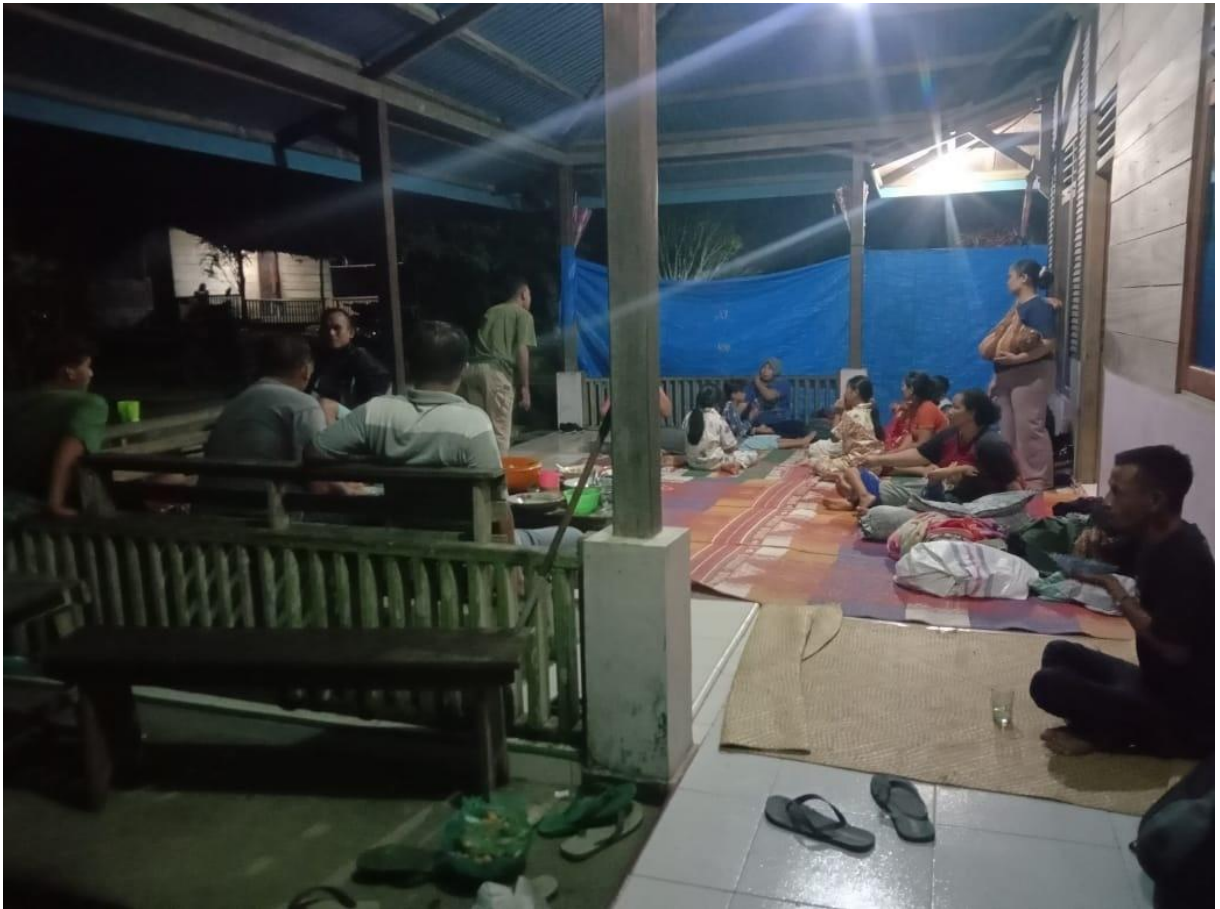
Gambar. Kondisi malam hari di salah satu rumah warga yang menjadi tempat pengungsian (30/08/2022)