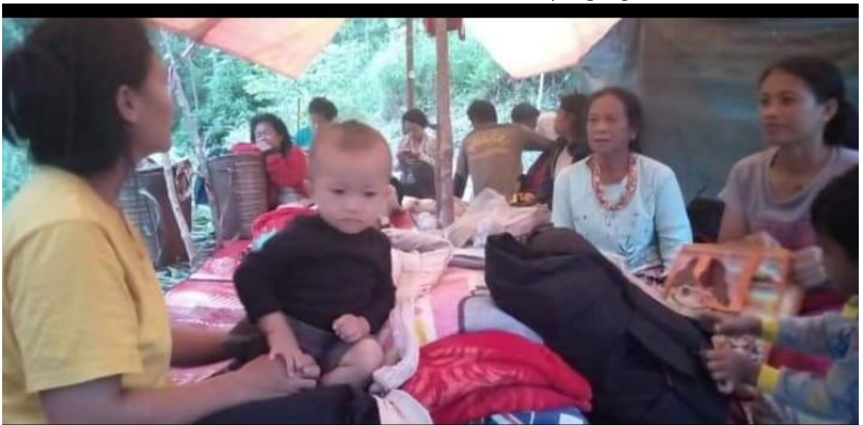
Gambar. Tenda darurat yang didirikan sementara oleh masyarakat.