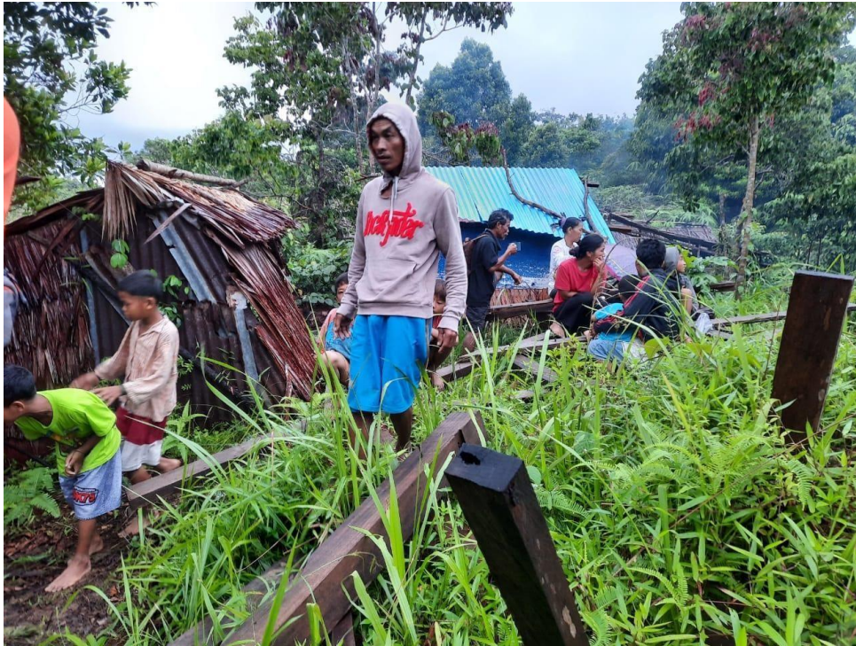
Gambar. Kondisi Masyarakat Desa Simalegi