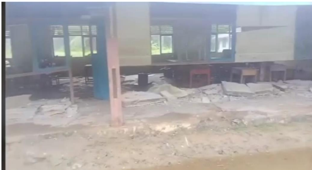
Gambar. Kondisi SDN 11 Simalegi Muara