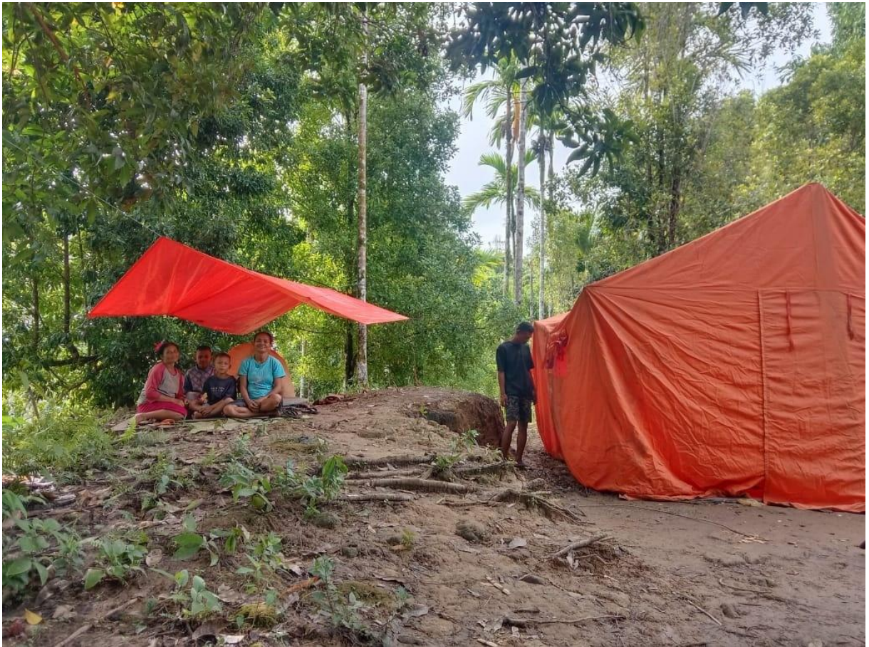
Gambar. Tenda BNPB di salah satu titik pengungsian