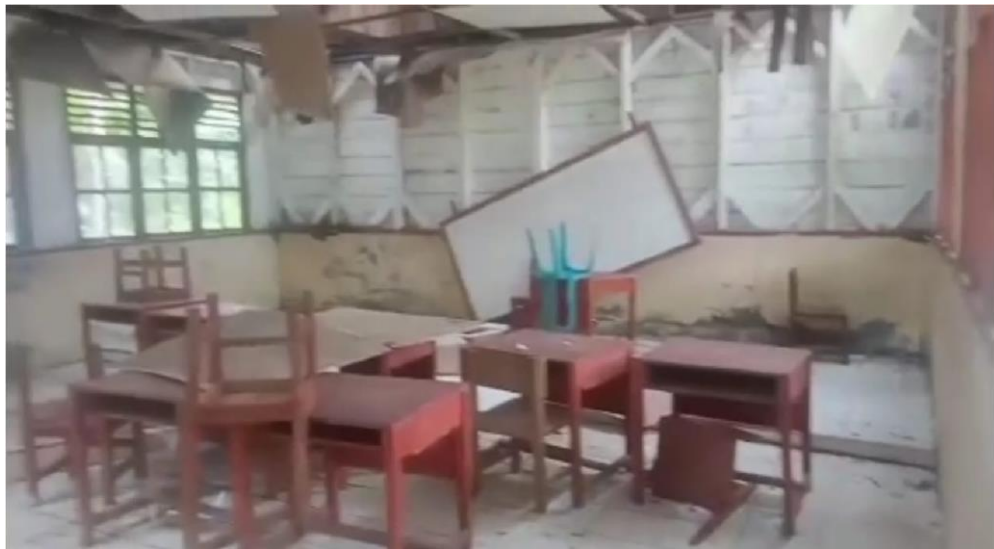
Documentasi Sisa SMP 3 yang sempat melakukan evakuasi mandiri di sekolah