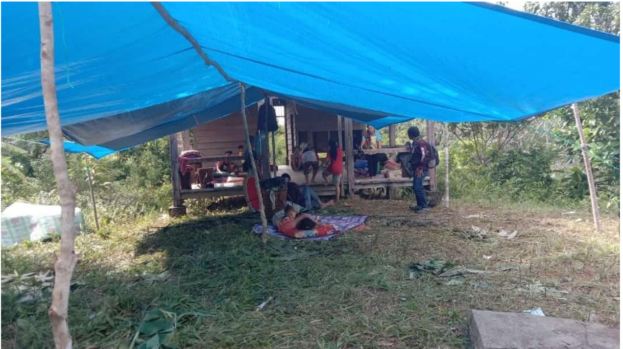
Gambar. Foto Tenda Darurat yang dibangun swadaya oleh masyarakat