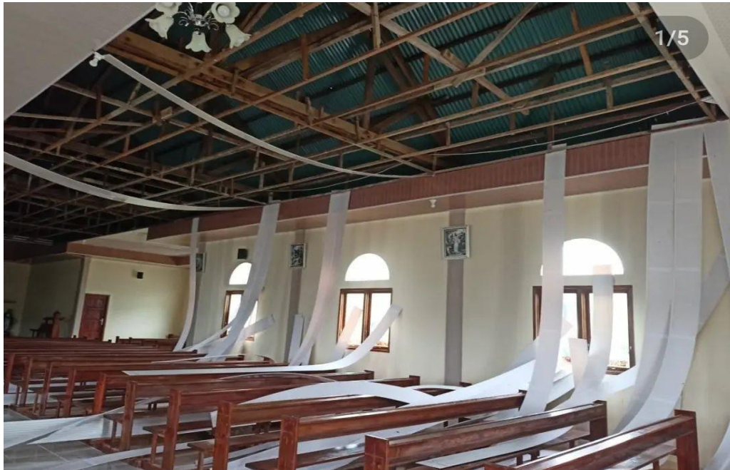
Gereja Katolik di Desa Simalegi